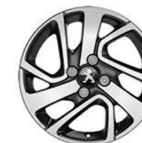
Jante Alu diamantée 15" Thorren (3)