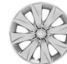
Enjoliveur 15" Brecola (2)