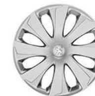
Enjoliveur 14" Xaurel (1)

(3) Disponible de série sur niveau Allure et Collection.